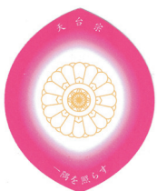
↑裏面は菊輪寶の図変更できません